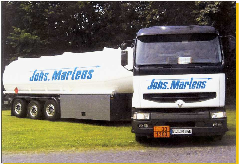
In der Samtgemeinde Hollenstedt kennt jeder Bewohner die Tanklastzüge der Firma Johs. Martens GmbH & Co. KG. Von Drestedt aus beliefern die Trucks Flughäfen und Tankstellen vom Erzgebirge bis an die Küste